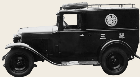
1935年から1940年頃に使用された三越専用車