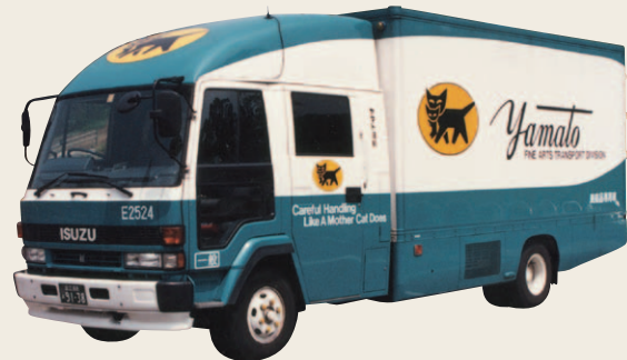
美術品専用車(1993年撮影)