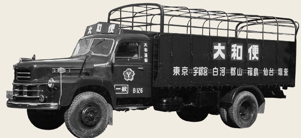
1950年から1960年代前半にかけて使用された大和便主力車両