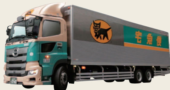
コーポレートカラーに塗装デザインを変更した大型車