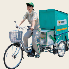
リヤカー付き電動自転車(2015年)