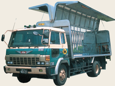
1967年から使用したコカ・コーラ輸送専用ガルウイング車