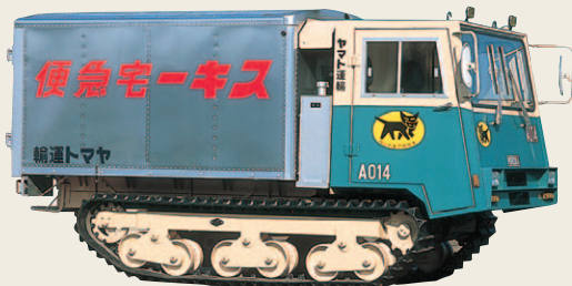
1985年から使用した雪上車