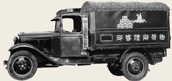
昭和初期に登場した婚礼専用車