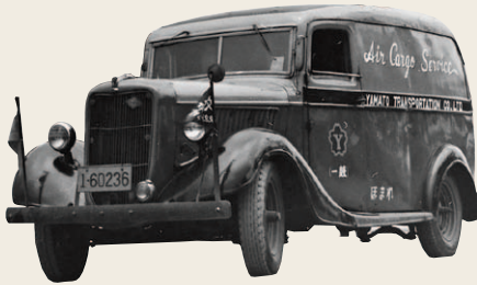
1950年代の国際航空貨物専用車