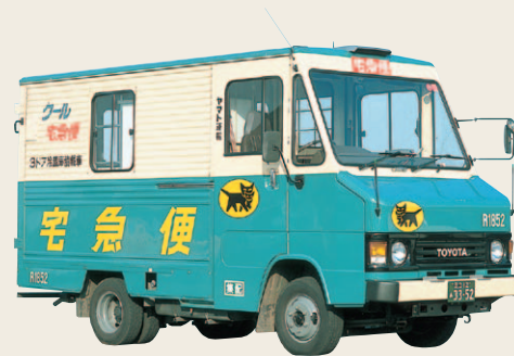
1981年8月に試作し、翌年5月から本格使用した宅急便集配車(ウォークスルー車)