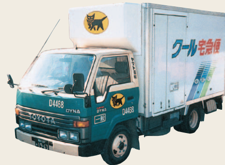
1987年から使用した2トンバン型冷凍専用車