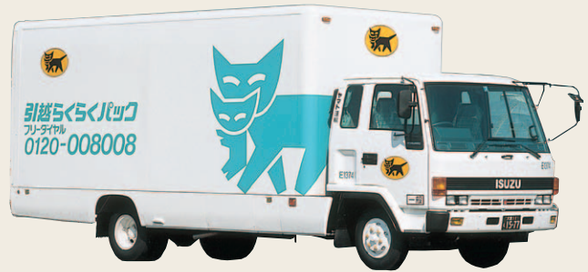
1990年から使用した引越らくらくバック専用車