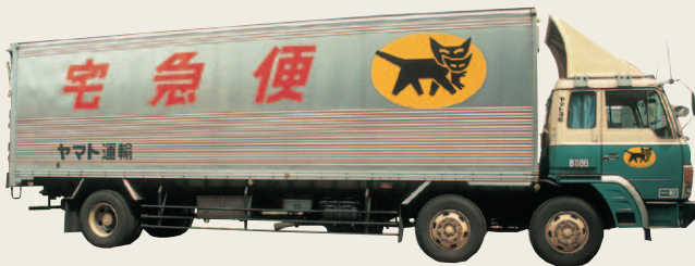
1980年頃から使用した前輪二軸の大型車