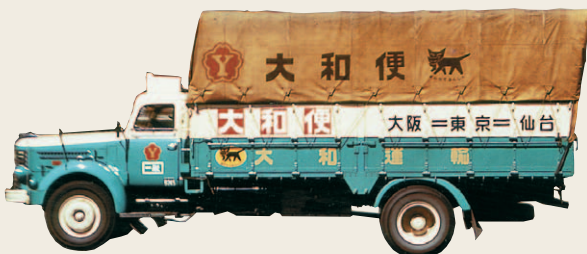
1960年から車色と塗装デザインを変更した大和便8トン車