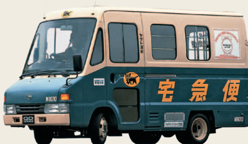
1999年に安全性の向上を目的にフルモデルチェンジしたウォークスルー車