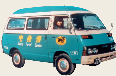
宅急便開始当時(1976年)に使用した集配車