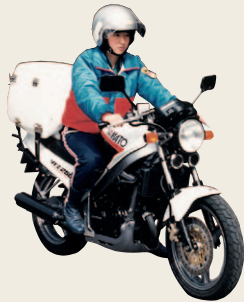
1986年から使用した「ビジネス時間便」オートバイ