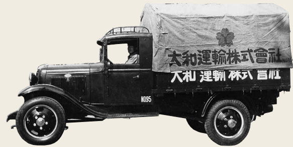
戦前から戦後にわたり使用された大和便主力車両