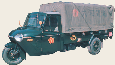
1960年頃まで集配車として活躍した三輪車