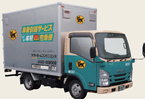
ホームコンビニエンス事業の車両(2010年代)