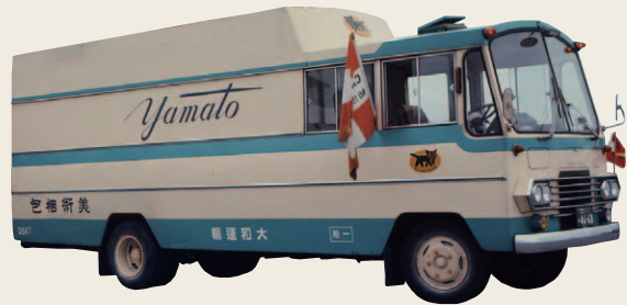
美術品専用車第1号(1964年)