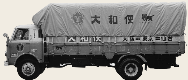
1960年代中頃から1970年代前半にかけて使用された大和便運行車