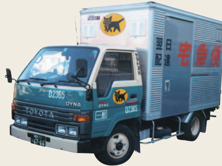
1979年から使用した宅急便2トンバン型集配車