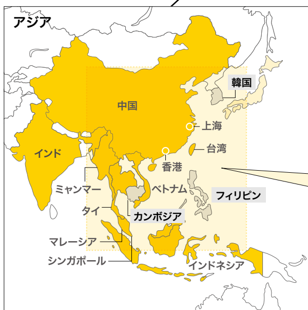
越境陸上輸送ネットワーク